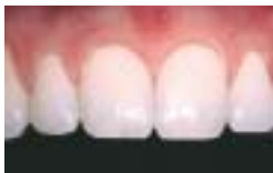
... und nach der Aufhellung